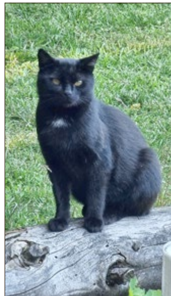
Kater Sammy drei Monate später