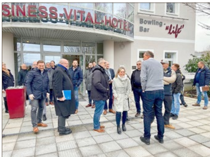
Das Unternehmerfrühstück des Friedberg Management Stammtisches fand im Business Vital Hotel statt.