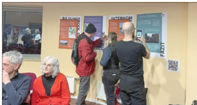
Auf Plakaten konnten die Teilnehmer der Veranstaltung die zentralen Ergebnisse der Studie nachlesen.

Die Projektergebnisse werden in Teilen auf der Projektseite https://www.uni-weimar.de/ritt von „Räume in Transformation Thüringen“ ab April/Mai 2025 verfügbar sein.